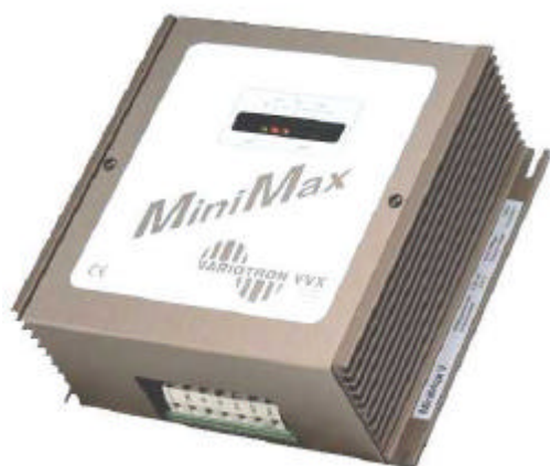
MiniMax V ukapslet