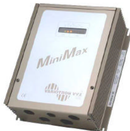
MiniMax VK kapslet